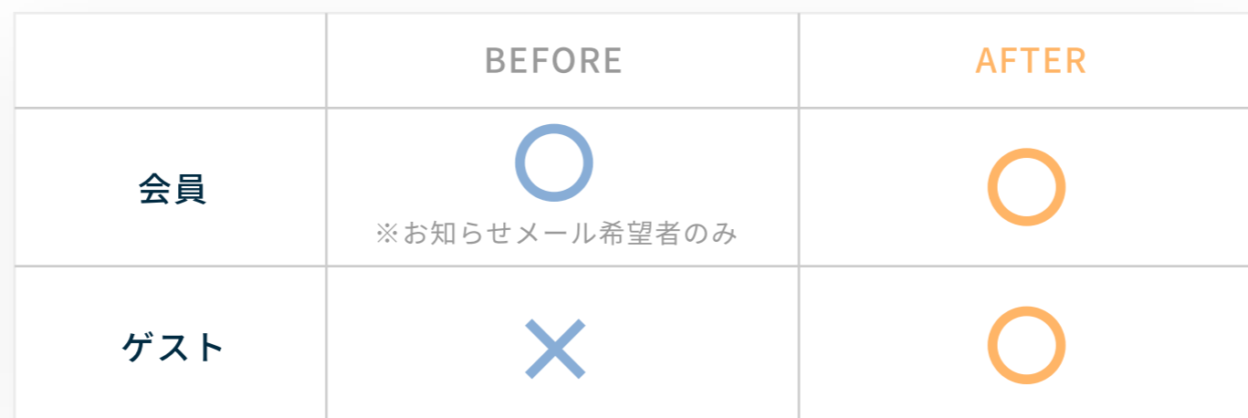
サンキューメール配信先

現状は、会員登録時に「お知らせメールを希望する」と選択した「会員登録済み」の予約者にもサンキューメールが配信されています。